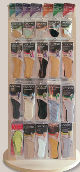
WANDA SILVER 622/38/01 53 x 59 x 150 cm