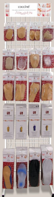
WIESIO WHITE METAL NET STAND 622/33/01 46 x 48 x 196 cm