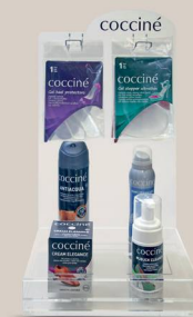
WALDI OPEN BRIGHT STAND IN ALDER COLOUR 622/39/01 25 x 22,5 x 45 cm