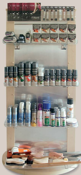
WANDA MAPLE 622/38/02 53 x 59 x 150 cm