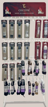
WIKTOR STAND FOR LACES METAL WHITE 622/37/03 37 x 25 x 85 cm