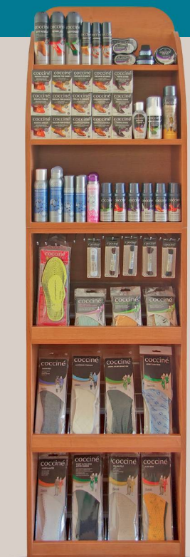
WITEK OPEN BRIGHT STAND IN ALDER COLOUR 622/34/05 52 x 37 x 210 cm