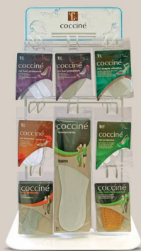
WALENTY FOR GEL PRODUCTS 622/37/04 32,5 x 30 x 70 cm